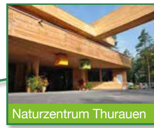
Naturzentrum Thurauen Naturzentrum bis Start/Ziel Erlebnisweg ca. 1,5 Stunden Fussmarsch.