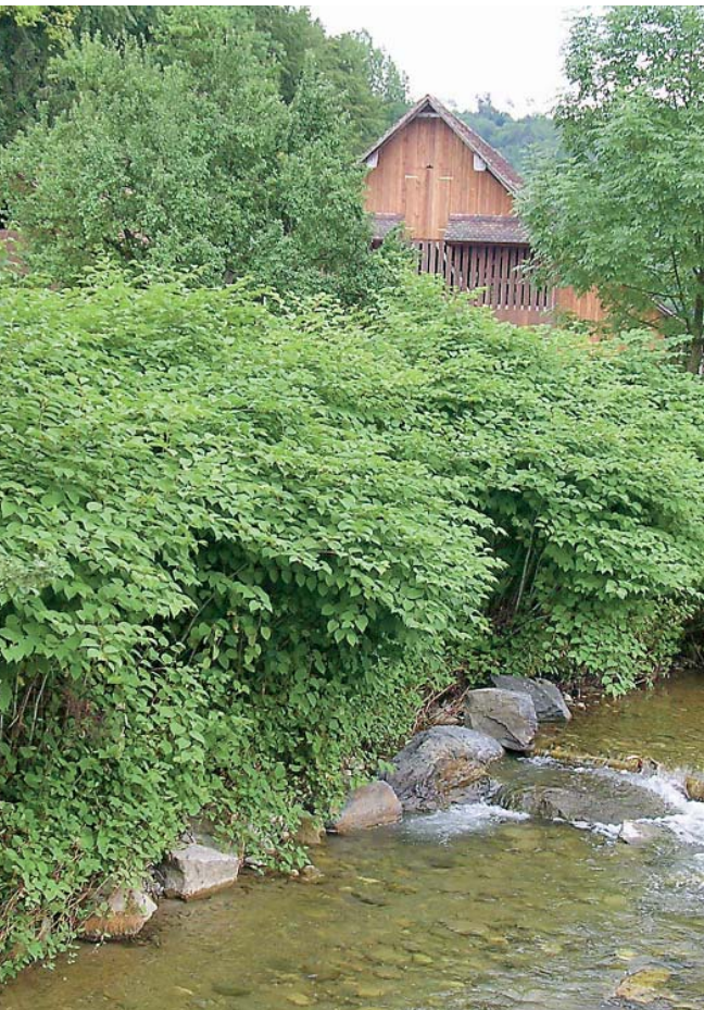
Asiatische Knötericharten breiten sich schnell entlang von Bachläufen aus und führen bei Hochwasser zu Erosionsproblemen.

Gleichzeitig hat die Verschleppung von Pflanzenteilen bei Mahd und Erdarbeiten sowie Erosion an Fliessgewässern zur Folge, dass die Art an immer neuen Standorten angesiedelt wird, wodurch die Standorte und die besiedelte Fläche laufend zunehmen. Je häufiger der Japanknöterich aber ist, desto eher wird er weiter verschleppt. Durch diesen Mechanismus breitet sich die Art immer schneller aus, kann in wenigen Jahren grosse Flächen besiedeln und zu ernsthaften Problemen und hohen Kosten führen.