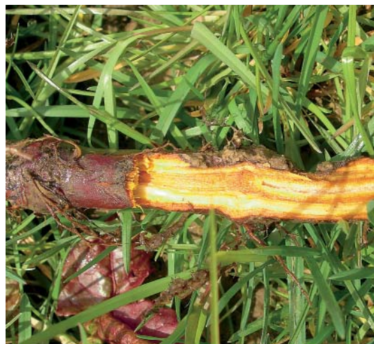
Die Rinde der Rhizome ist (rot- bis) dunkelbraun, das Gewebe gelb-orange