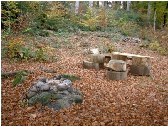
6) Feuerstelle und Picknickplatz im Warteraum Schwändi.