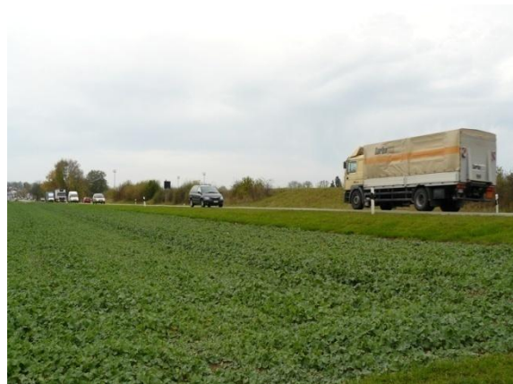
7) Hauptverkehrsstrasse «Zürichstrasse» mit Wildwechsel.