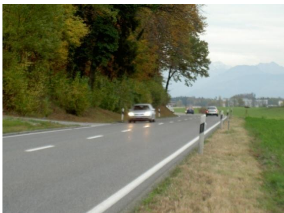
12) Hauptverkehrsstrasse «Hinwilerstrasse» mit Wildwechsel.