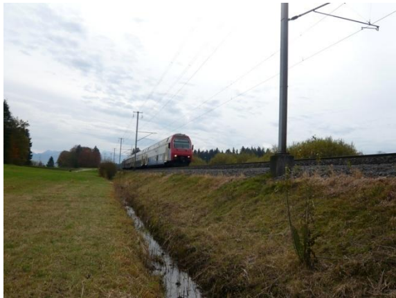
2) Wildwechsel über die einspurige Bahnlinie Wetzikon-Rüti.