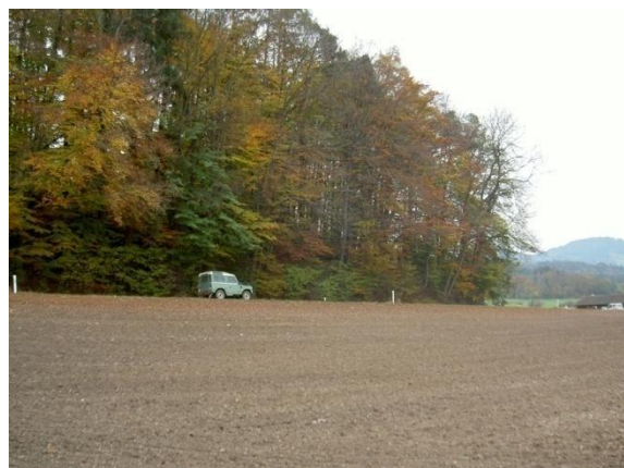
9) Regionale Verbindungsstrasse «Bad Erlösen-Moos» mit Wildwechsel.