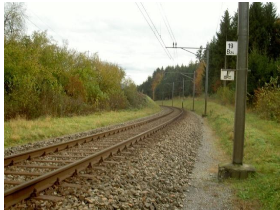
4) Wildwechsel über die einspurige Bahnlinie Wetzikon-Hinwil.