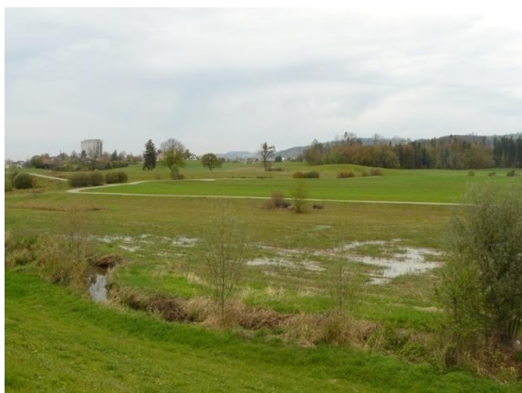
8) Trittstein in der Grosswis ist zu klein, bietet nur wenig Deckung.